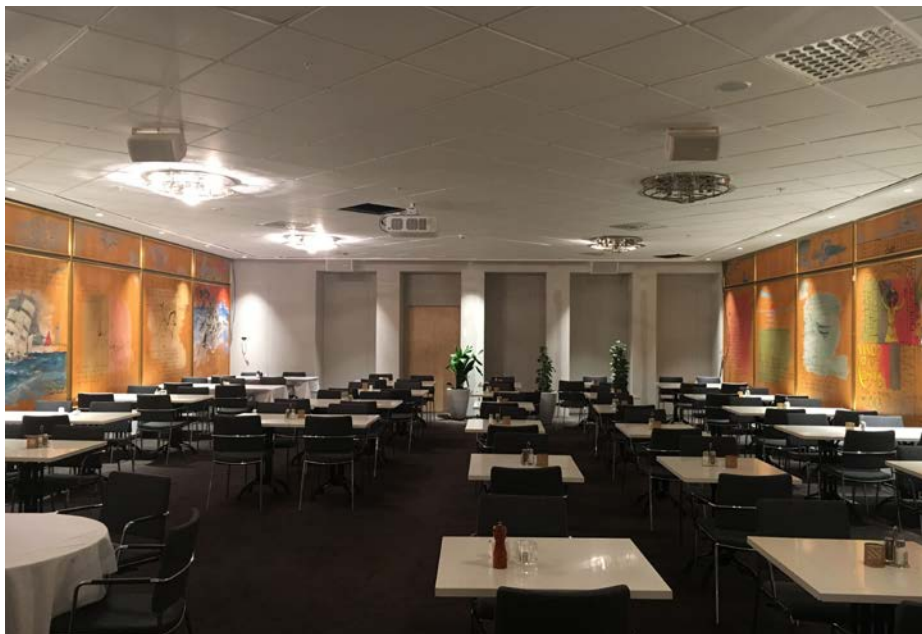
I den lite mindre Taubesalen placerades RMU08 längst fram och RMU05 i delay.

13 x TSW-760 (sjutums touchskärm) 8 x ZMC2 (dukrelä) 1 x DIN-8SW8