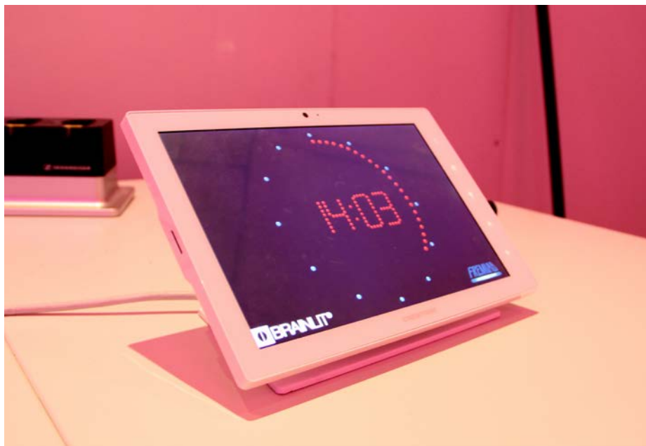
I bankettsalen finns den sju tum stora touchskärmen TSW-760 från Crestron.