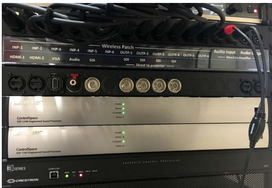
Här kan vi se Bose ControlSpace ESP-1240 vilande i sitt rack. Under den har en Crestron CP3 skjutits in.